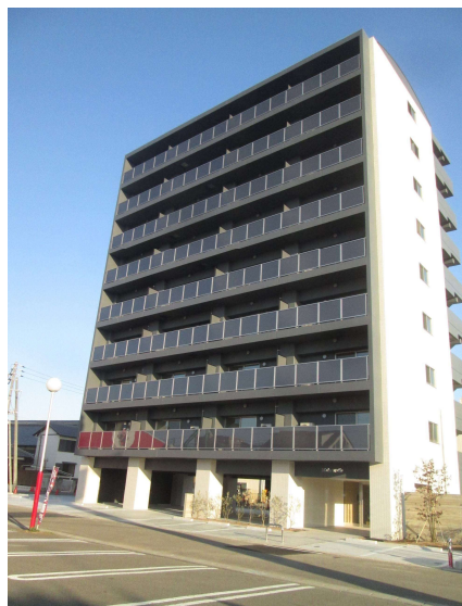
2021年2月竣工 エルフィーノⅢ新築工事