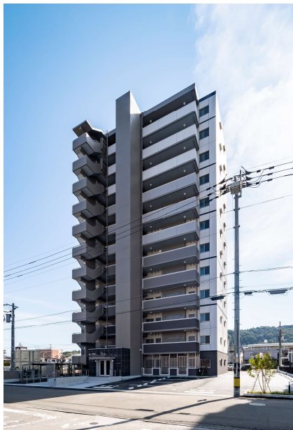
2021年2月竣工 高須マンション新築工事